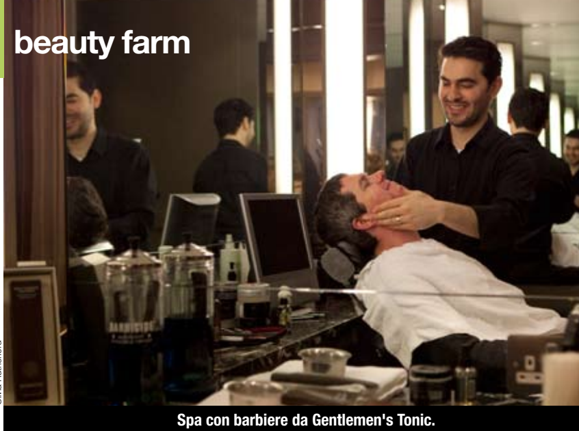
Spa con barbiere da Gentlemen's Tonic.