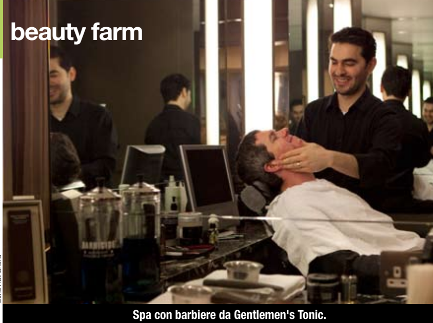
Spa con barbiere da Gentlemen's Tonic.